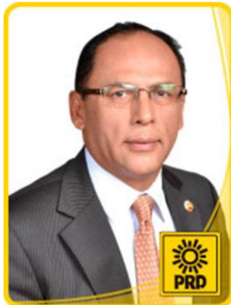
Dip. Saúl Benítez Avilés.